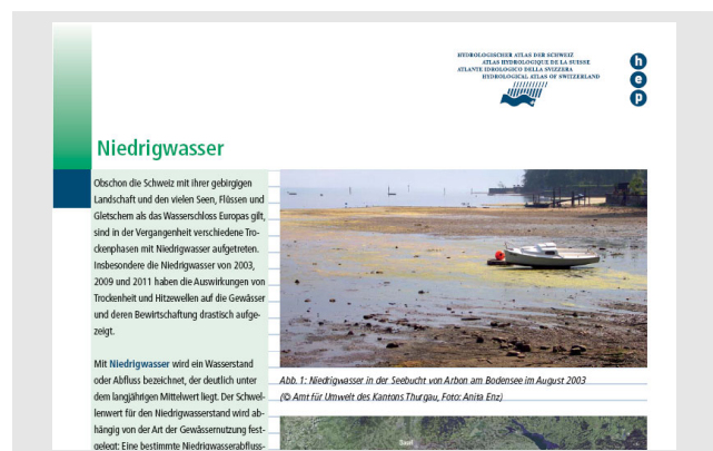
Abb. 2 Ausschnitte der Titelblätter von «WASSERverstehen»